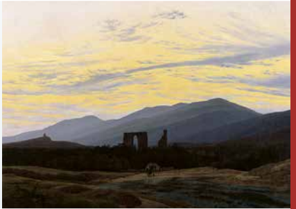
Rechts: Caspar David Friedrich, »Ruine Eldena im Riesengebirge«, 1830/34, Öl auf Leinwand, Pommersches Landesmuseum, Greifswald

Die Klosterruine Eldena war ein Lieblingsmotiv von Caspar David Friedrich.