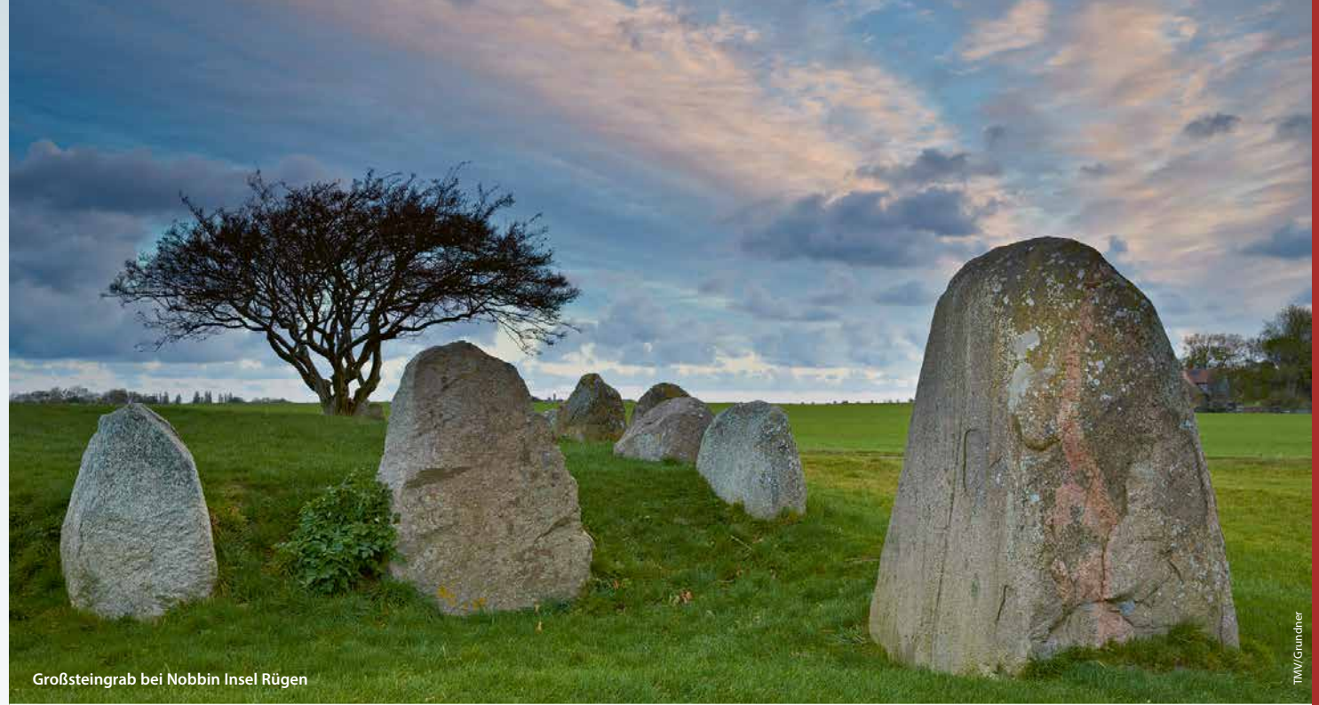
Großsteingrab bei Nobbin Insel Rügen