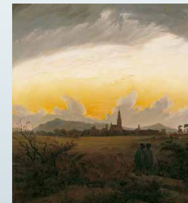
Rechts: Caspar David Friedrich, »Neubrandenburg«, um 1816/17, Öl auf Leinwand, Pommersches Landesmuseum, Greifswald

Oft besuchte Caspar David Friedrich den Geburtsort seiner Eltern und zeichnete verschiedene Motive in und um Neubrandenburg wie die Stadttore, Türme und Kirchen, die noch heute beeindruckend sind.