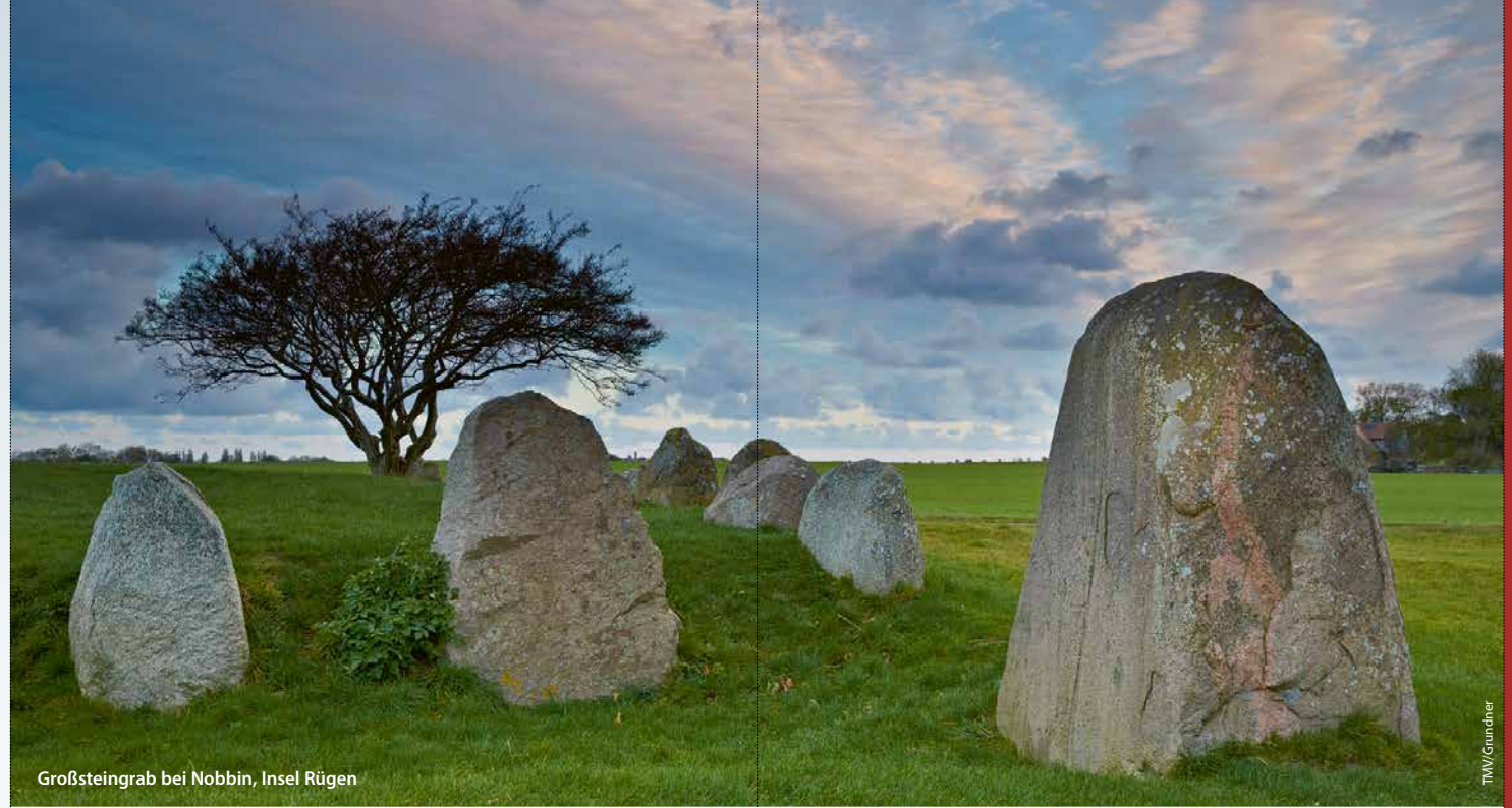
Großsteingrab bei Nobbin, Insel Rügen