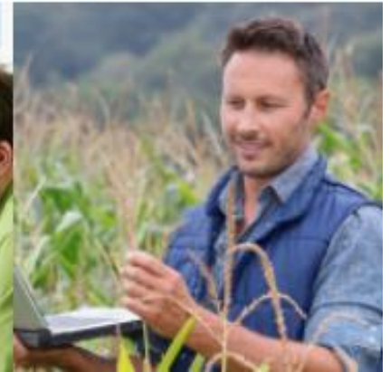
Maßnahmen mit Berufsabschluss